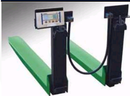
Versione con indicatore sulle forche