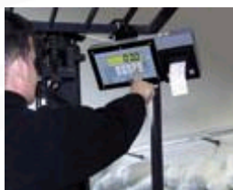
Versione con indicatore (unico) a bordo del carrello

Coppia di forche con pesatura integrata per carrelli elevatori. Disponibili per piastra FEM2A o FEM2B (fino a max. 2500 kg) oppure FEM3A (fino a max 5000 kg). Anche se lo spessore delle forche risulta aumentato questa soluzione offre la massima semplicità di montaggio, e non comporta riduzione della portata del carrello elevatore. Le forche devono essere semplicemente sostituite a quelle del carrello